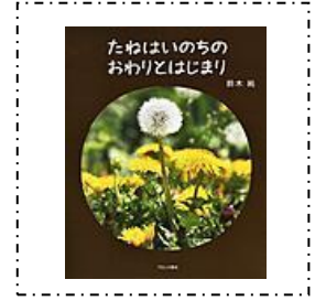
『たねはいのちのおわりとはじまり』 ブロンズ新社 鈴木 純/著