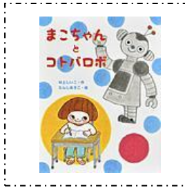
『まこちゃん と コトバロボ』 佼成出版社 村上しいこ/作