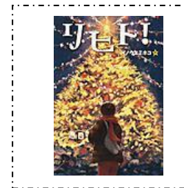
『リヒト!』 ぶんけんしゅつぱん 文研出版 イノウエミホコ/作