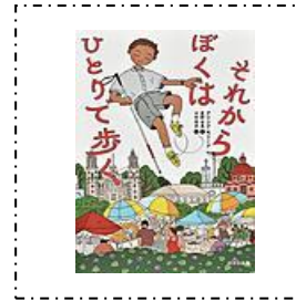
『それからぼくはひとりで ある 歩く』 ほるぶ出版 アリシア・モーリア/作