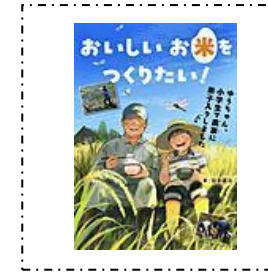
『おいしいお米をつくりた い!』 汐文社 谷本 隆治/作