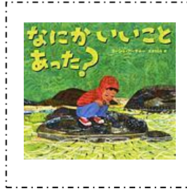
『なにが いい こと あった?』 BL出版 ミーシャ・アーチャー/作