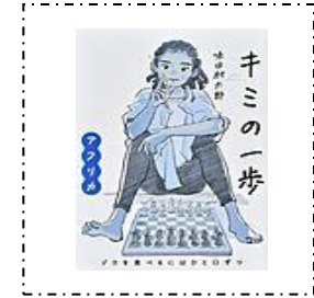
『キミの一步アフリカ』 あかね書房 あじたむらたろう/作 味田村 太郎/作