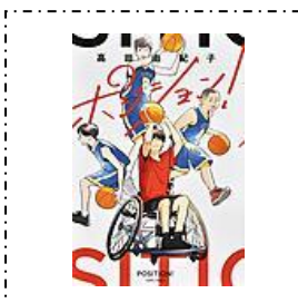
『ポジション』 岩崎書店 高田由紀子/作