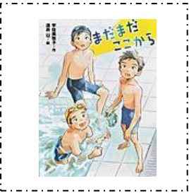
『まだまだここから』 ポプラ社 宇佐美牧子/作