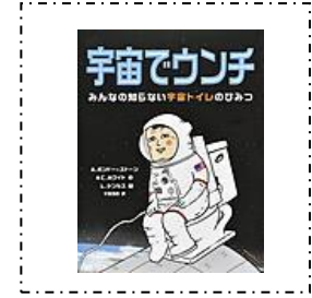
『宇宙でウンチ』 あすなろ書房 A.ポンドー=ストーン/作