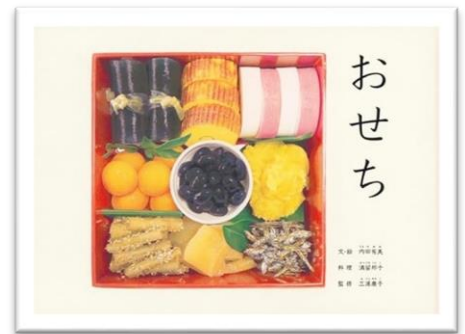
「おせち」 内田有美作 福音館書店