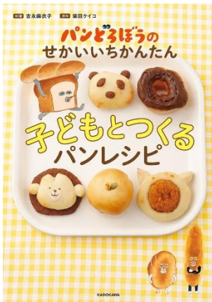
「パンどろぼうの せかいいちかんたん 子どもとつくるパンレシピ」 吉永麻衣子 柴田ケイコ KADOKAWA