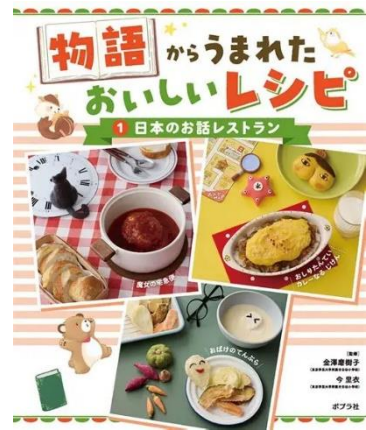
「物語からうまれた おいしいレシピ」 金澤磨樹子 今里衣監修 ポプラ社