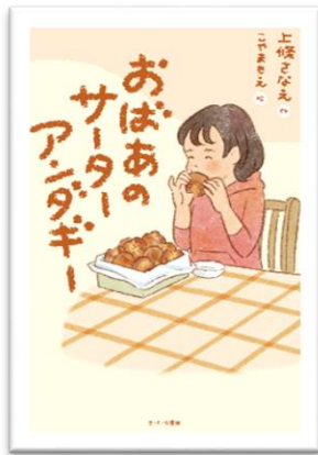
「おばあ サターアングリー」 上條さなえ作 さ・え・ら書房