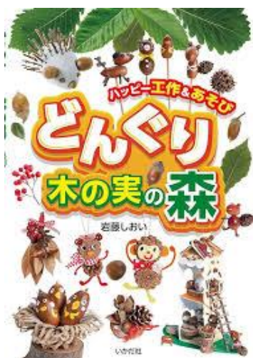
「どんぐり木の実の森」