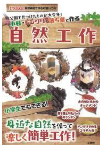
「小枝・どんぐり・落ち葉 で作る自然工作」