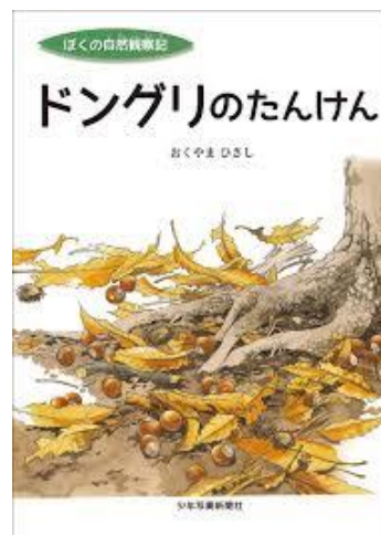
「ドンぐリのたんけん」