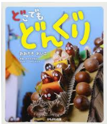
「どこでも どんぐり」