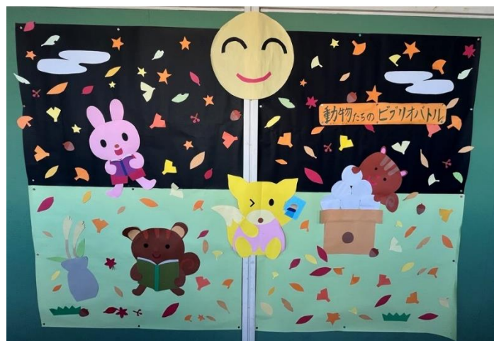
図書ボランティアさんによる壁画