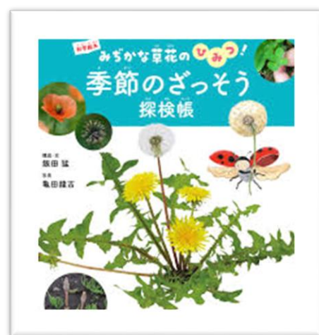
「季節のざっそう探検帳」