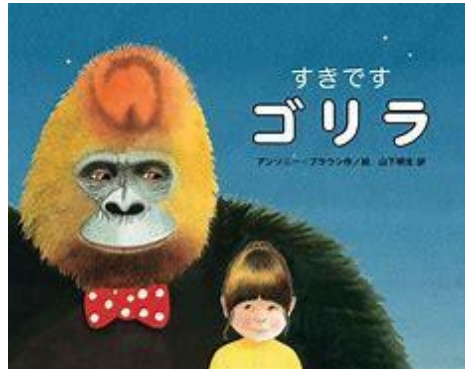
すぎです ゴリラ アンソニー・ブラウン／作・絵 山下 明生／訳 あかね書房