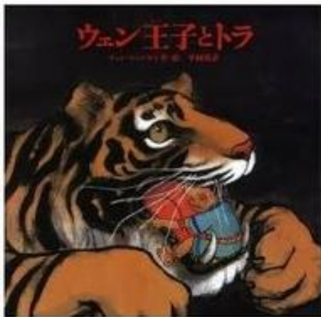
ウェン王子とトラ 陳 江洪・チェン ジャンホン／著 平岡 敦／訳 徳間書店

トラの絵がとてもダイナミックに描かれていて、迫力があります。子ども達もじっくりと物語を聞いてくれました。