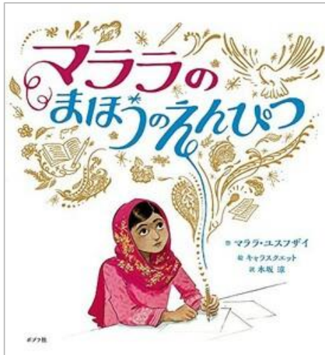
マララのまほうのえんぴつ マララ・ユスフザイ／著・文 キャラスクエット／イラスト 木坂 涼／訳 ポプラ社