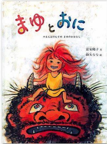
まゆとおに 富安 陽子／文 降矢 なな／絵 福音館書店