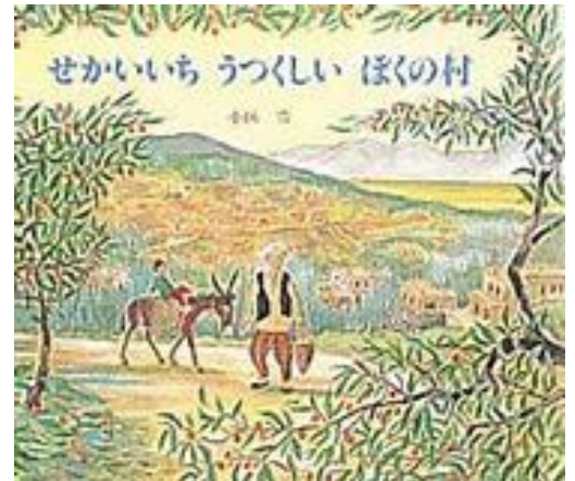
せかいいち うつくしい ぼくの村 小林 豊／作 ポプラ社

以前、5年生で読んで好評だったため、今回もまた選びました。お話の結末まで読み進めたあとに、ストーリーの伏線になるアイテムを、ページを戻りながら目をキラキラさせて探してくれました。