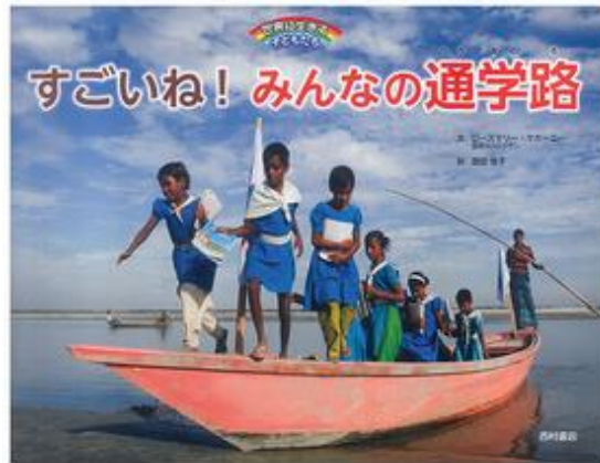
すごいね!みんなの通学路 ローズマリー・マカーニー／著・文 西田 佳子／訳 西村書店